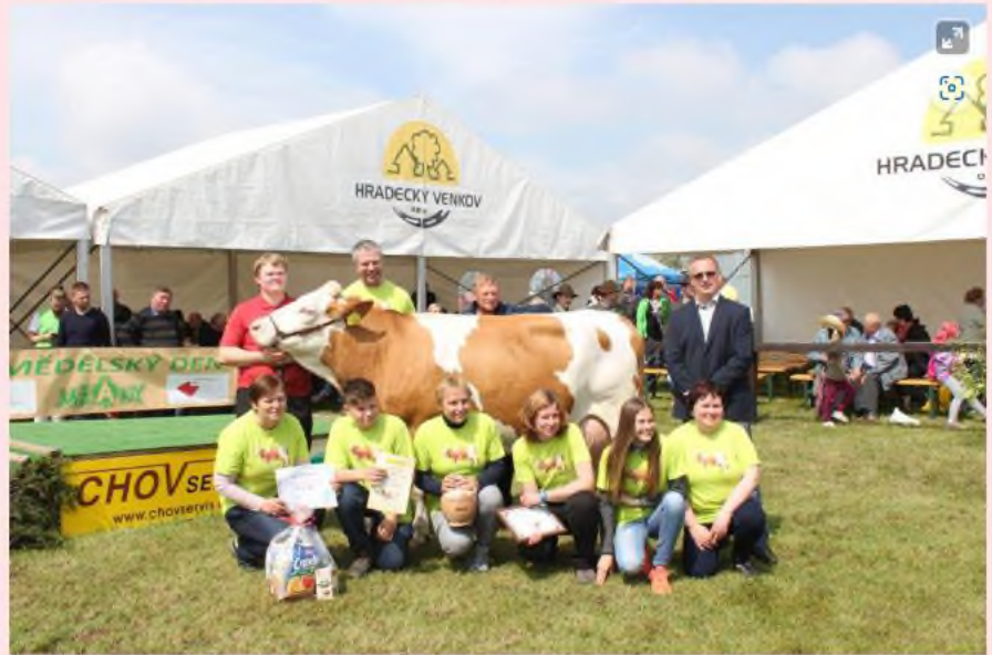
Tradiční zemědělský den v Sovětích, obci oceněné Oranžovou stuhou v roce 2012

Nejvíce oceněných obcí lze opět nalézt v okrese Náchod (6 držitelů).